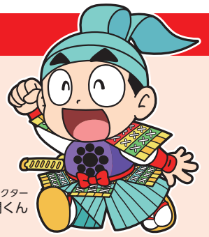
坂東市マスコットキャラクター 将門くん